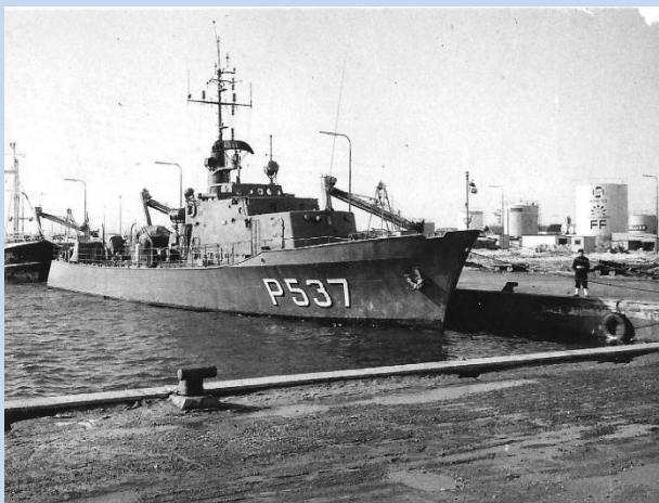
Bevogtningsfartøjet RAN i Skagen havn, 1970

Tiden i Søværnet var en rigtig god tid. Auderød lejren, som eksercerskole blev kaldt i daglig tale, udfordrede med mange nye færdigheder, såsom våbenbrug, brandbekæmpelse, og ikke mindst, den legendariske skude Lappedykkeren , som vel nok kan kaldes den danske flådes mest "rolige" skib. Lappedykkeren , som jeg desværre ikke har noget billede af, var et modelskib i fuld størrelse, bygget op på en stor græsplæne. Her blev der indøvet forskellige sømandsfærdigheder, såsom fortøjning, kast med kasteline, m.m. i stille og rolige omgivelser.