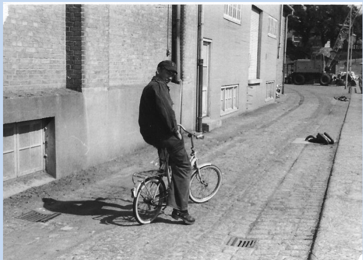
Cykelgast i Rønne 1970

Senere gik turen til overvågningsopgaver i den vestlige del af Østersøen, med Stubbekøbing som basehavn. Det var blevet rigtig sommer og opgaverne var rimelige, så også her blev det til nogle hyggelige sommeroplevelser i denne dejlige by. Vores opgaver her, var hovedsageligt farvandsovervågning og