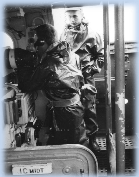
Overvågningsopgaver i Østersøen

holde øje med Østtyskerne og Russerne som havde skibe med lytteudstyr liggende tæt på de danske østersøkyster, den kolde krig var jo et "varmt" emne på den tid. Men ellers nød vi sommeren med dens mange glæder i form af søde piger, og koldt øl.