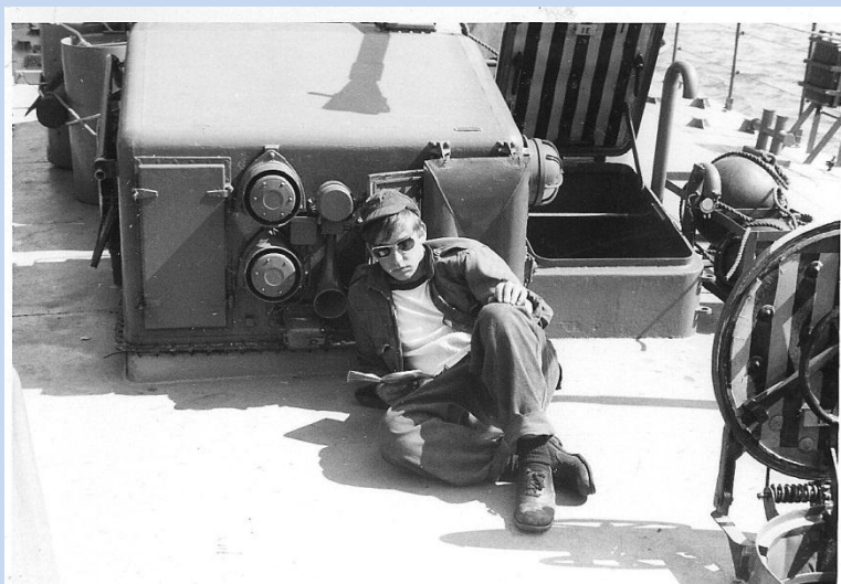
En stille stund i solen

Med skibene Ran og Najaden kom vi rundt i hele landet på forskellige opgaver. Der var fiskeripatrolje i Vesterhavet, med Esbjerg som basehavn. Her var vi under den store fiskerikonflikt i 1970. Det var første, og eneste gang, jeg har set så mange fiskekuttere samlet i en havn på en gang. Det gav rigtig liv i havneværtshusene et par dage, noget vi gaster i høj grad var deltagere i, hvis man ikke lige var uheldig at have vagttjeneste. Fiskeripatrolje i Esbjerg bestod bl.a. i at kontrollere de udenlandske fiskere, hovedsagelige tyske og hollandske kuttere, der fiskede i farvandet ud for Esbjerg og øerne i Vesterhavet. Vi skulle kontrollere at de holdt sig uden for den danske fiskerigrænse, og i øvrigt ikke fiskede ulovligt.